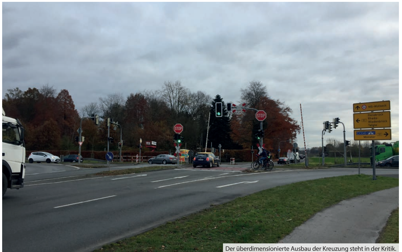
Der überdimensionierte Ausbau der Kreuzung steht in der Kritik.

Auch im Hinblick darauf, dass der Bundeswehrstandort möglicherweise vergrößert wird, sei es wichtig, die Lützowstraße an die B 51 anzubinden. Ansonsten würden Panzer und weiterer Schwerlastverkehr wieder durchs Dorf rollen, so wie schon früher.