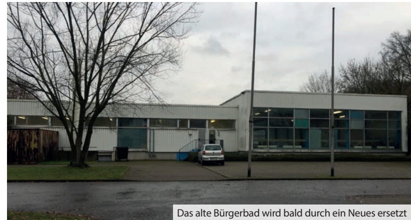
Das alte Bürgerbad wird bald durch ein Neues ersetzt

Am 22. November ist die Baugenehmigung für das neue Bürgerbad bei den Planern eingetroffen. Auch wenn innerhalb des Verfahrens einige Nachforderungen erbracht werden mussten, ist der Antrag ohne Probleme durch die beteiligten Ämter der Stadtverwaltung abgearbeitet worden.