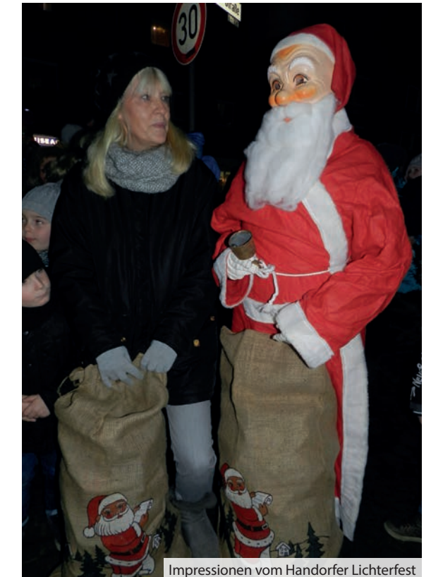
Impressionen vom Handorfer Lichterfest