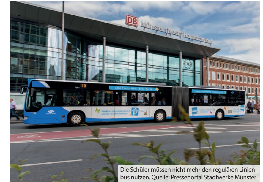
Die Schüler müssen nicht mehr den regulären Linienbus nutzen.