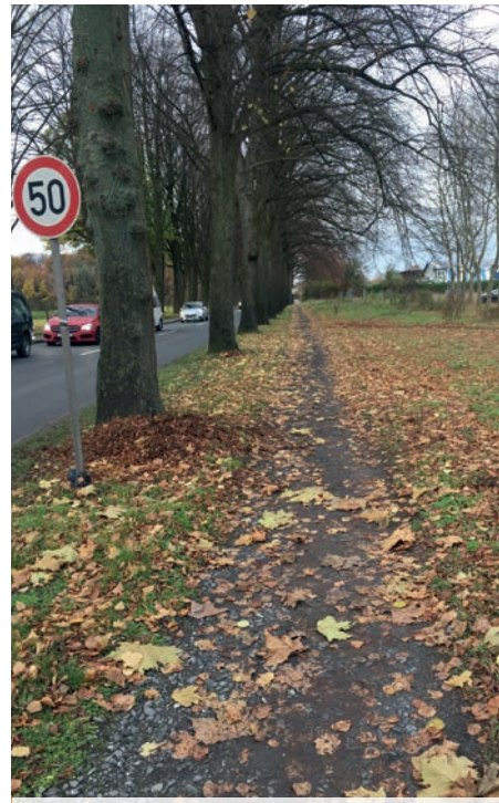
Dieser Radweg muss dringend erneuert werden.

Herr Unger vom Amt für Mobilität und Tiefbau berichtet in der Sitzung zum Sachstand der Wersebrücke. Die Holzfundamente, die 1988 in den Boden gerammt wurden sind morsch und deshalb hat die Brücke keine Stabilität mehr. Nun muss schnell gehandelt werden. Die Bezirksvertretung Münster Ost hat bereits in einer vorherigen Sitzung den Beschluss gefasst, dass die Wegeverbindung von Dorbaum nach Gelmer während einer Neubauphase der Brücke nach Möglichkeit durchgängig erhalten bleibt. Daher muss die jetzige Brücke instandgehalten werden, bis eine neue Brücke gebaut und genutzt werden kann. Die Planungen für den Neu-