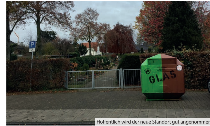
Hoffentlich wird der neue Standort gut angenommen.

Die Abfallwirtschaftsbetriebe Münster (AWM) haben diese Anregungen gemeinsam mit dem Unternehmen, das von den „Systemen“ nach dem Verpackungsgesetz mit der Altglasverwertung beauftragt ist, intensiv geprüft. Aus fachlicher Sicht unstrittig handelt es sich um einen Standort, der von den Handorferinnen und Handorfern sehr gut akzeptiert und auch genutzt wird. Daher wurden diese