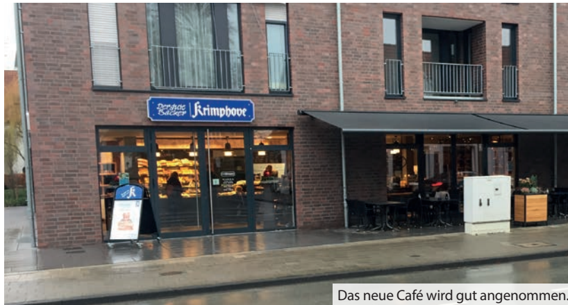
Das neue Café wird gut angenommen.