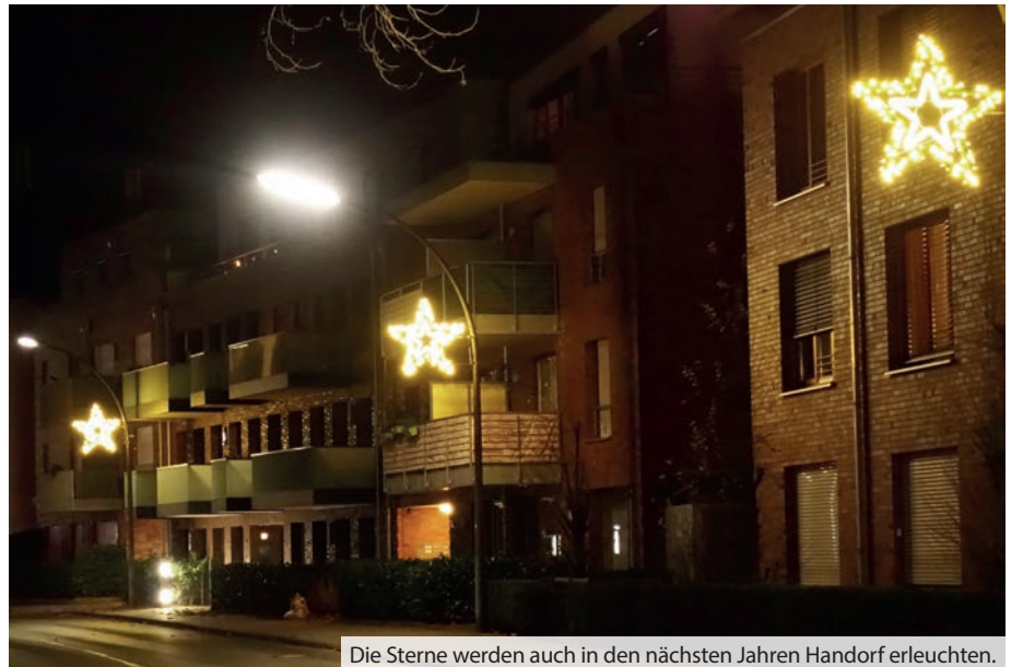
Die Sterne werden auch in den nächsten Jahren Handorf erleuchten.